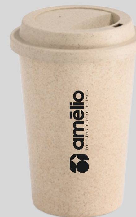
Copo de Bambu 450ml