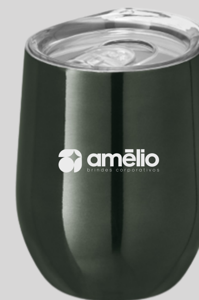
Copo de viagem 400ml