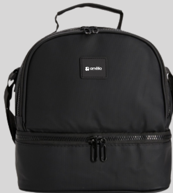
Bolsa térmica dupla 7 litros