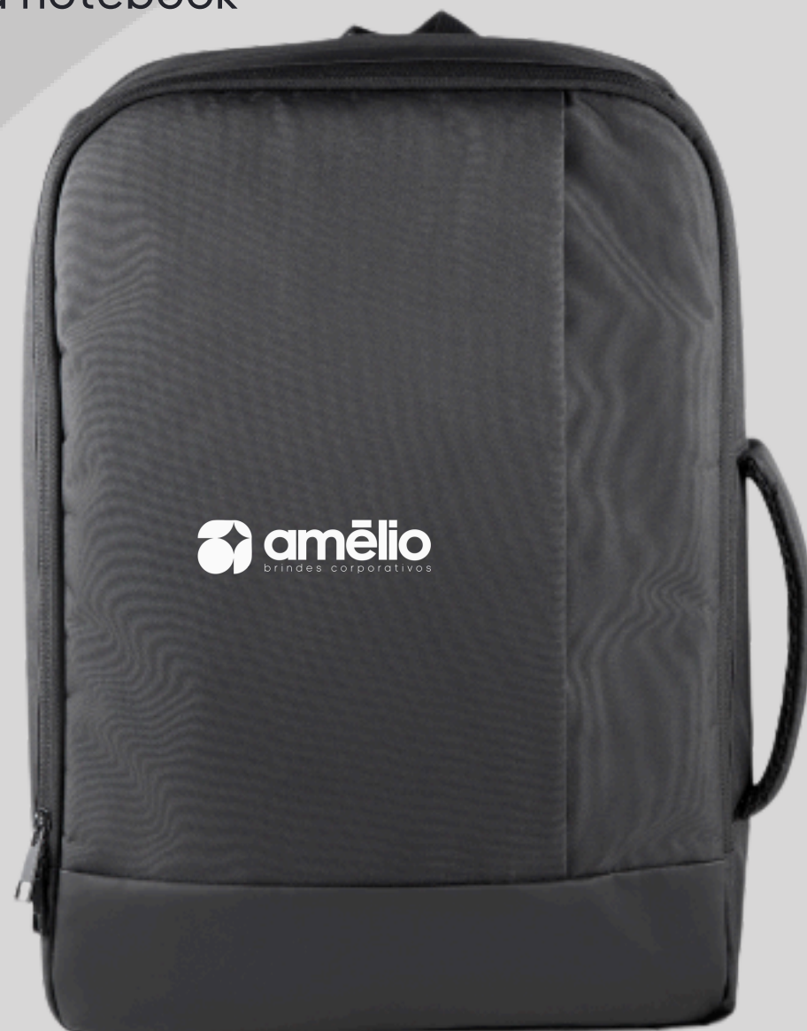
Mochila Pasta Executiva para notebook