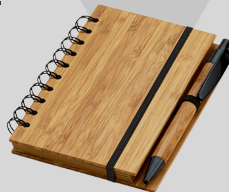
Caderno de bambu com caneta