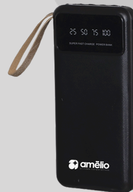
Power Bank com lanterna