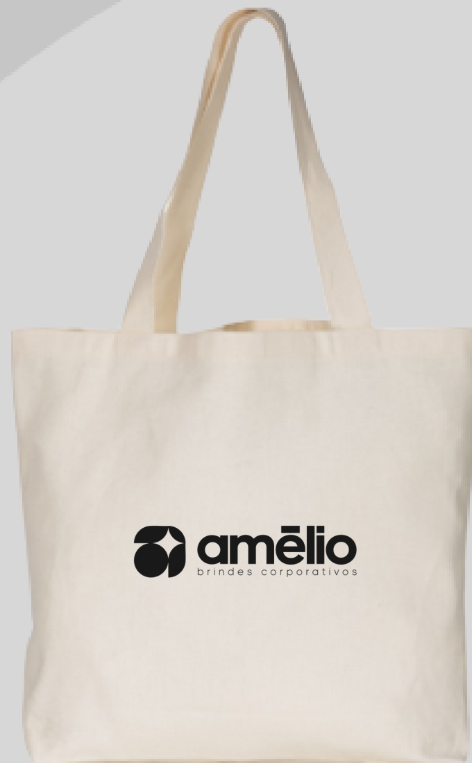
Sacola de Algodão